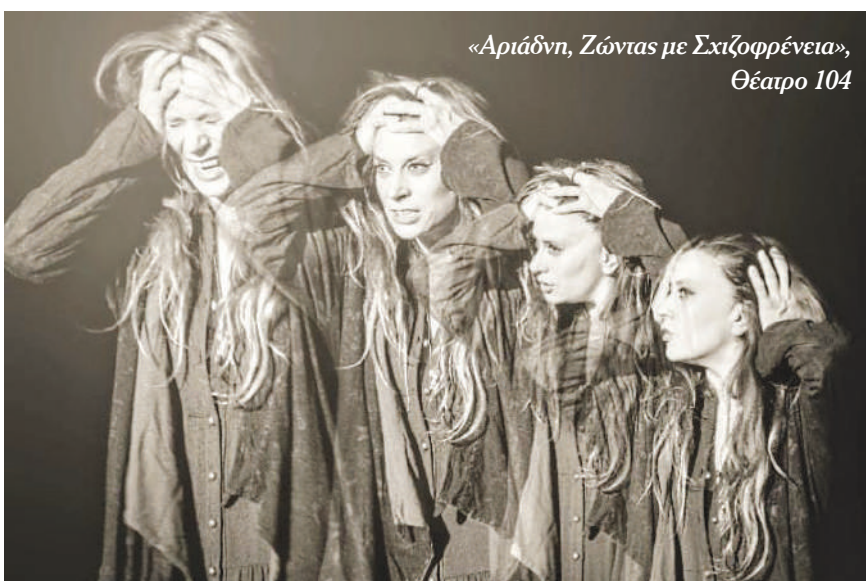
«Αριάδνη, Ζώντας με Σχιζοφρένεια», Θέατρο 104

Το θέατρο (μέσα από τα κατάλοιπα της υλιστικής κι άθους πλέον τελετουργίας – παραδοσιακής ή νεότευκτης) λειτουργεί και δραμα-