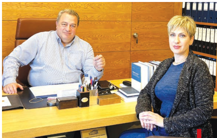
Ο Ευριπίδης Στυλιανίδης, Βουλευτής ΝΔ Ροδόπης με τη δημοσιογράφο της ΤΡ, Μάρθα Λεκκάκου.

Θέλει περισσό θράσος για να κάνει μια τέτοια διατύπωση δημόσια. Πρώτον, αυτό για το οποίο εμείς ελέγχουμε την Κυβέρνηση είναι ένα κακό, απαράδεκτο, απολύτως πρόχειρο και κακοφτιαγμένο νομοσχέδιο του 2011 που νομοθέτησε το ΠΑΣΟΚ, με το οποίο καταργείται η αρχή των ελέγχων και αντικαθίσταται από