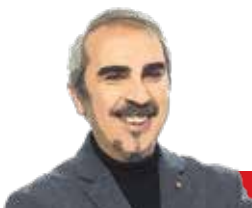
Του: Βαγγέλη Πτεργή

Η εμβέλεια μιας ηγετικής αριστερής φυσιογνωμίας δεν περιορίζεται στα υπονοούμενα, τις εξαγγελίες, τα προγράμματα και τις κυβερνητικές δεσμεύσεις. Όπως συνέβη με τον Τσε Γκεβέρα, γίνεται μπλουζάκι, μαντινάδα, σύνθημα, καθοδηγεί τη σκέψη, δημιουργεί μόδα και επαναστατικό κλίμα