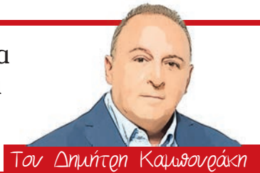
Τον Δημήτρη Καψουράκη

Η εικόνα του χαμογελαστού Ερντογάν να κρατά στα χέρια του την συνθήκη ειρήνης και φιλίας ανάμεσα σε Ελλάδα και Τουρκία, είναι εντελώς παράταιρη με όσα είχαμε συνηθίσει τα τελευταία χρόνια