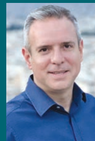
■ Σελ. 20

«Πάμε τον Βύρωνα Μπροστά – Ενωμένοι, αλλάζουμε τα δεδομένα»