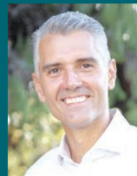
■ Σελ. 18

«Κοιτάω πάντα μπροστά για λύσεις στα καθημερινά προβλήματα»