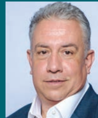
■ Σελ. 24

«Προχωράμε μαζί, κάθε μέρα και ένα βήμα μπροστά»