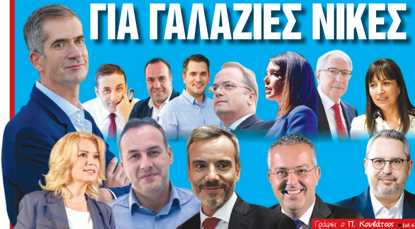
Γράφει ο Π. Κονιάτσος ■ Σελ. 4-7

Για πραγματικές λύσεις στα καθημερινά προβλήματα των τοπικών κοινωνιών