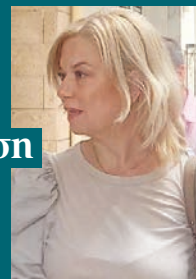
■ Σελ. 19

«Είμαστε έτοιμοι για την ανασυγκρότηση του δήμου Λαγκαδά»