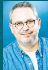
■ Σελ. 25

«Φιλοζωία: Ένας διάλογος μεταξύ ανθρώπου και φύσης»