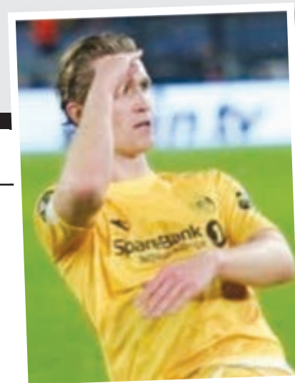
Σολμπάκεν για Ολυμπιακό